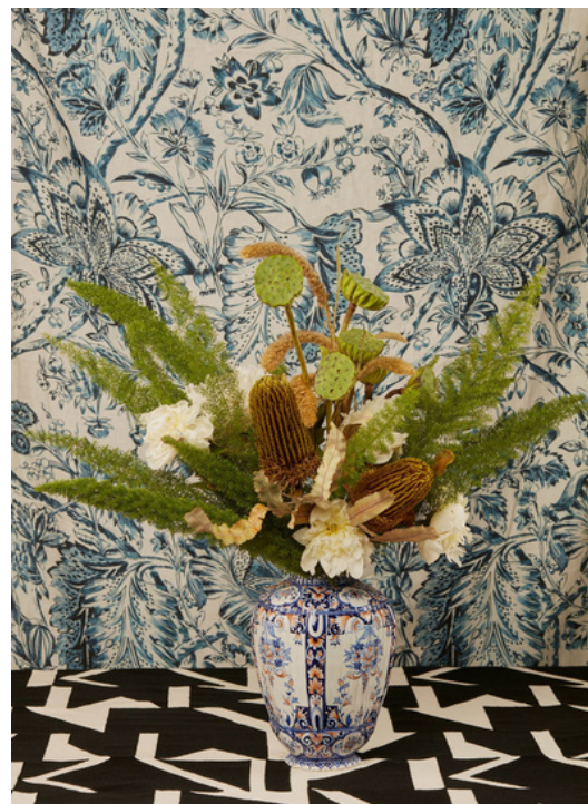
Debeaulieu, Création florale