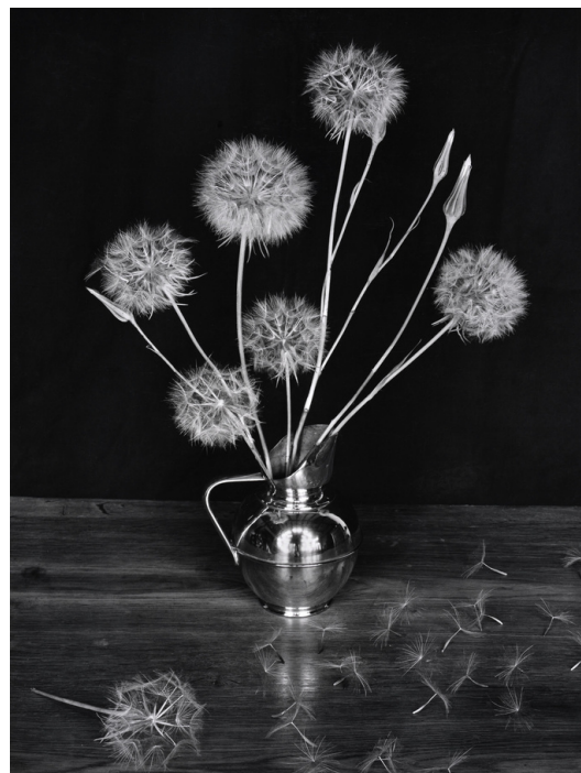
Jean-Pierre Sudre, Le vase aux pissenlits, Merville, 1955, 40x30cm, collection particulière

Jean-Pierre Sudre débute comme laborantin et assistant reporter avant de se tourner en 1949 vers la photographie. C'est à cette époque qu'il réalise ses premiers "sous-bois" et "natures mortes". Ses recherches le poussent vers des harmonies contrastées aux noirs et blancs vibrants, dont le résultat tend à magnifier les objets du quotidien. Son esthétique est marquée par le travail en chambre noire et par des expérimentations sur les tirages. En 1957, il reçoit le Lion d'Or à la Biennale Internationale de la Photographie de Venise. Il est promu Officier de l'Ordre des Arts et des Lettres en 1997.