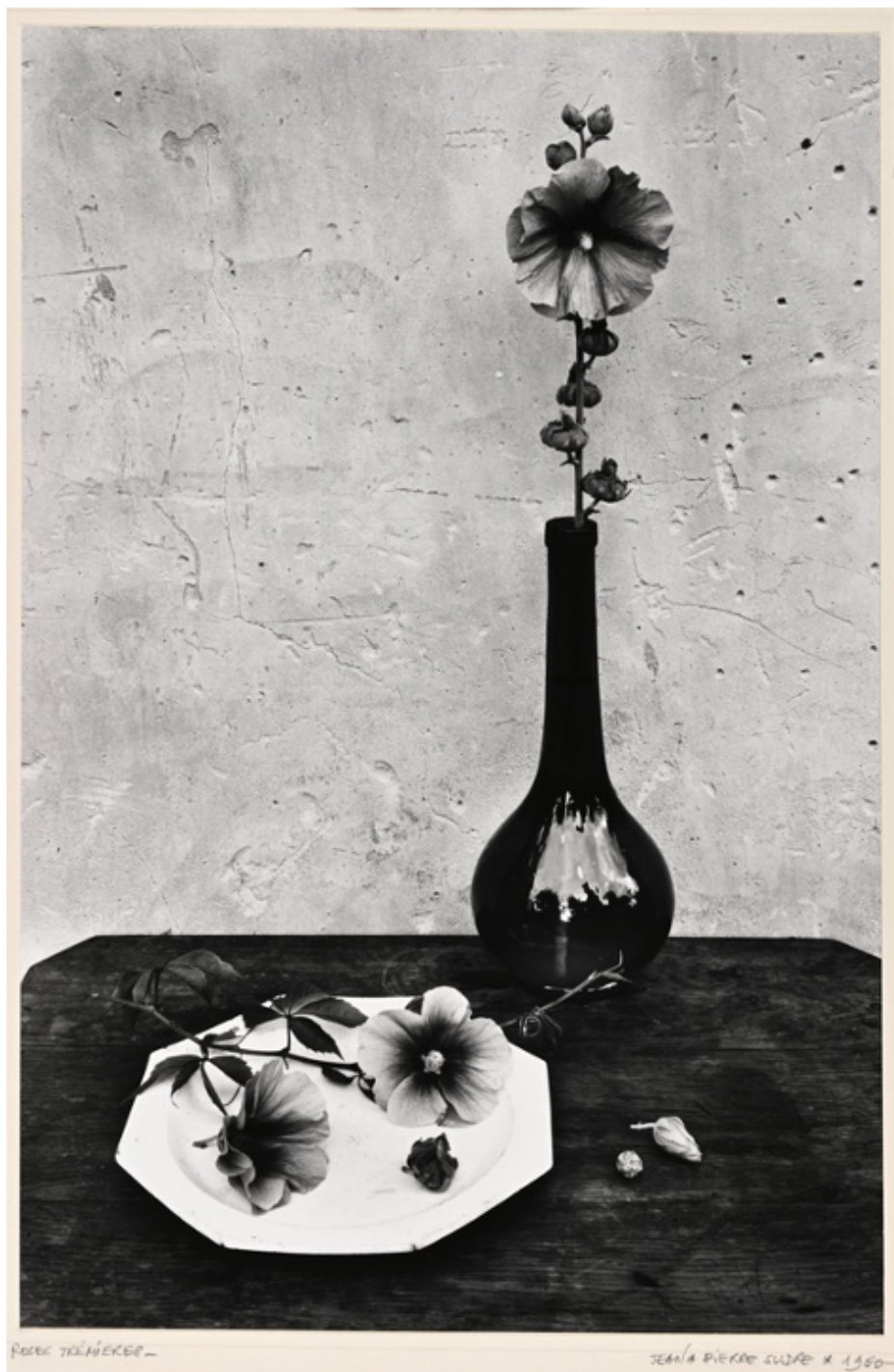
ROSES TRÉMIÈRES JEAN-PIERRE SUDRE X 1950 JEAN-PIERRE SUDRE Roses Trémières, 1952, tirage des années 70/80 Tirage argentique 30x40 cm