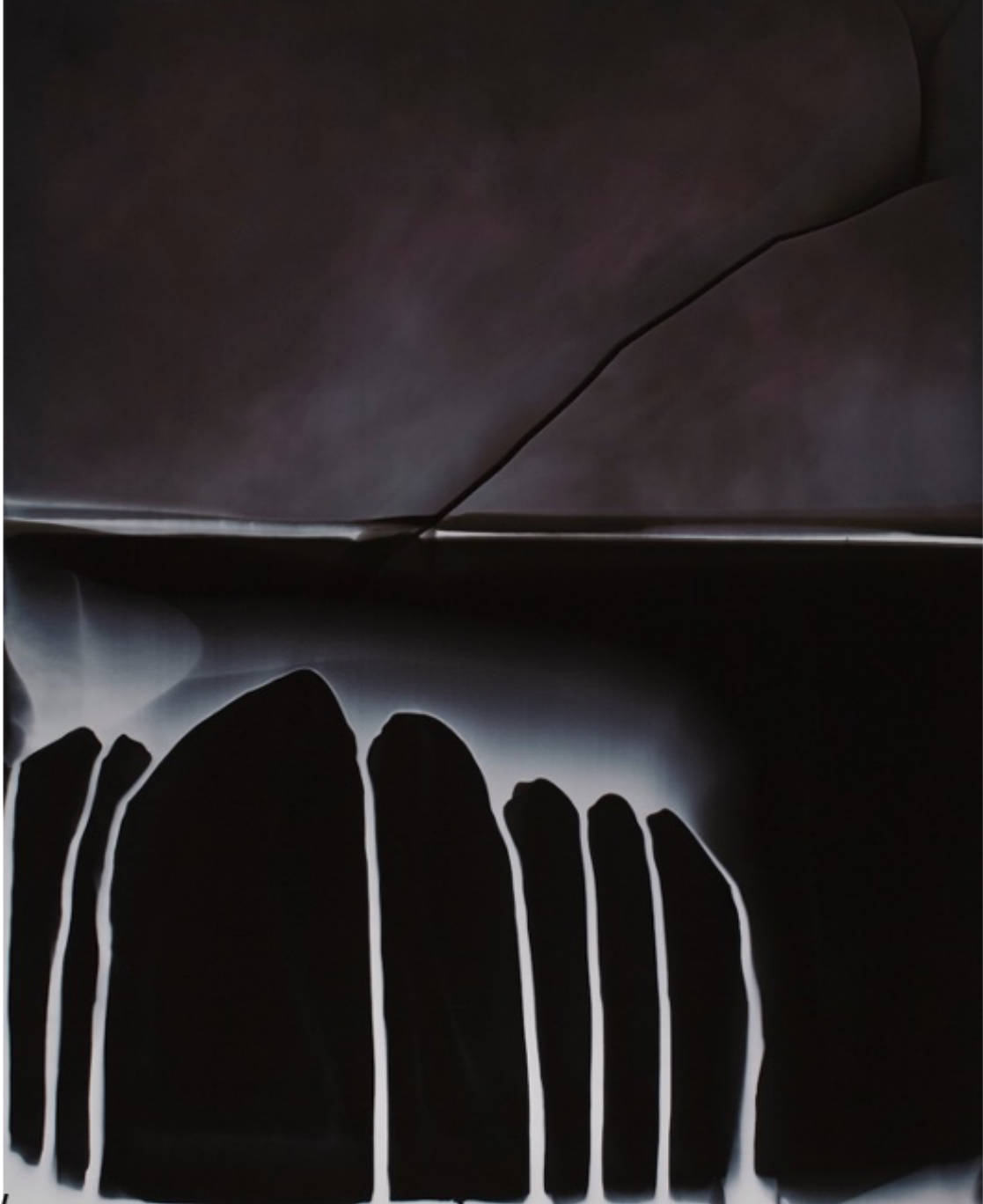
CHUCK KELTON, Resist #23, 2019 Photogramme et chimigramme sur du papier argentique 50x40 cm Unique

quand les fleurs nous sauvent / galerie miranda