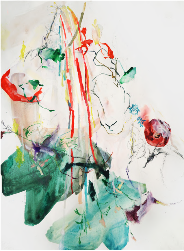
série "fleurs milieu", 2023, technique mixte sur papier, 76 x 56 cm. 2700€ (enc.)