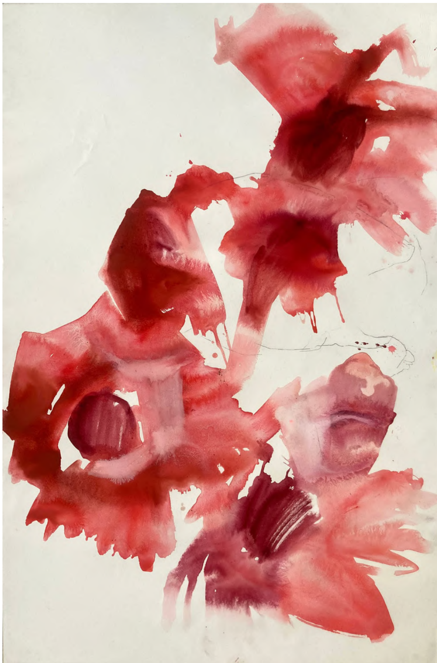
sans titre ( anémones, eau, couleurs I ), 2024, technique mixte sur papier, 120 x 80 cm. 3800€

« nous trouverons un chemin... ou nous en créerons un. »