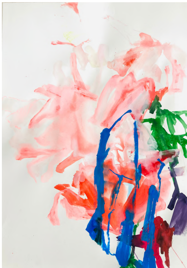
sans titre, 2024, technique mixte sur papier, 100x70cm. 3000€