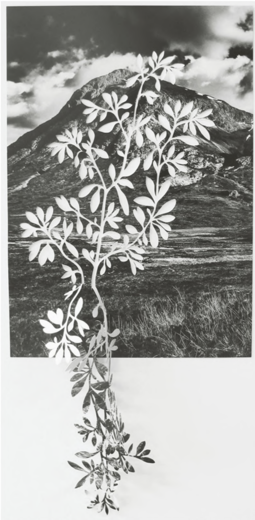
calceolaria, 2023, impression sur papier bamboo hahnemühle 290g découpé à la main, 80 x 41 cm. 2500€