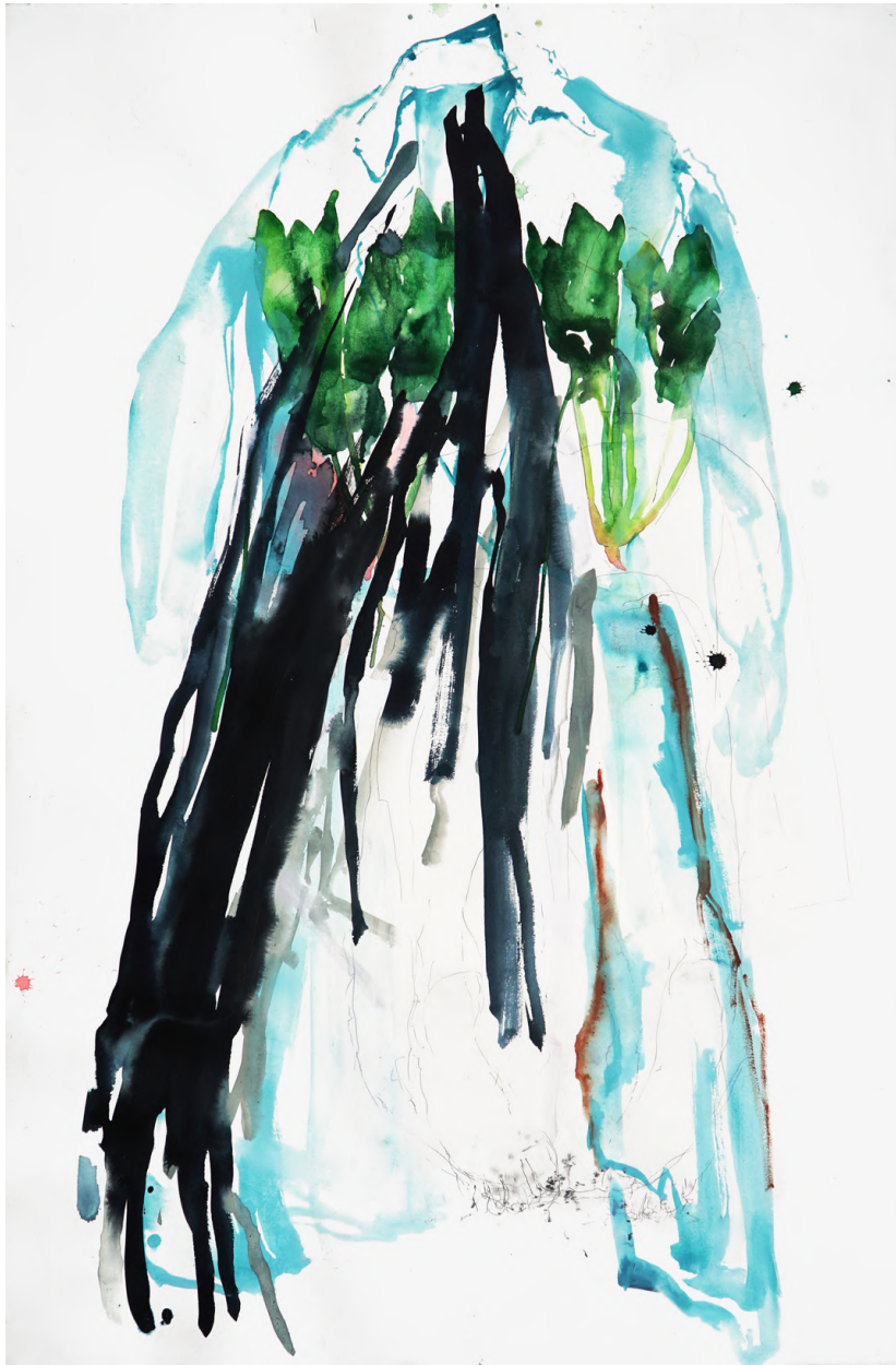
manteau bleu , 2023, carbone, aquarelle et encre sur papier, 120 x 80 cm. 3800€