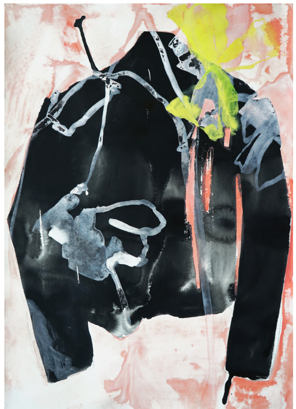
veste noire, 2023, aquarelle, mélange d'encres et gouache sur papier, 70 x 50 cm. 2200€