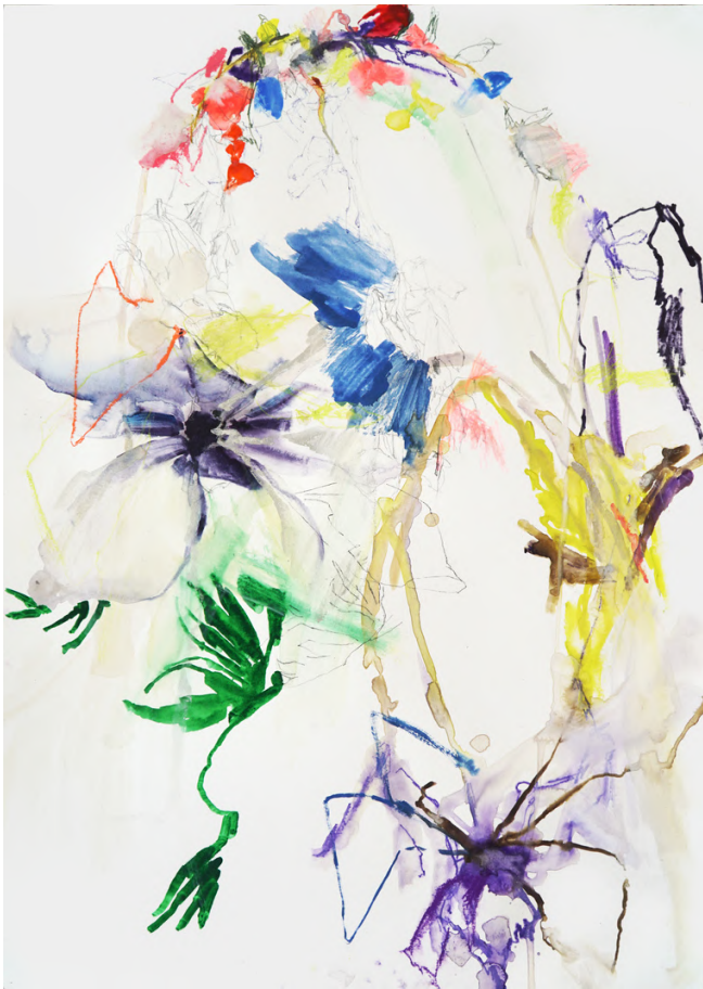
série "fleurs milieu", 2023, technique mixte sur papier, 70 x 50 cm. 2200€