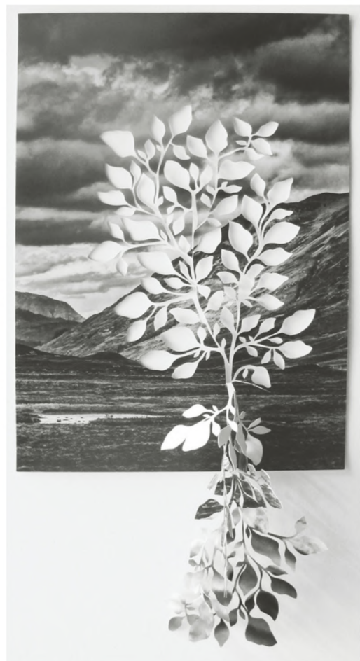
calceolaria 2, 2023, impression sur papier bamboo hahnemühle 290g découpé à la main, 80 x 41 cm. 2500€