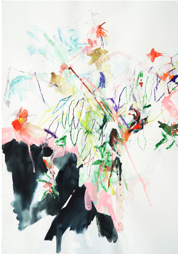
série "fleurs milieu", 2023, technique mixte sur papier, 100 x 70 cm. 3500€ (enc.)