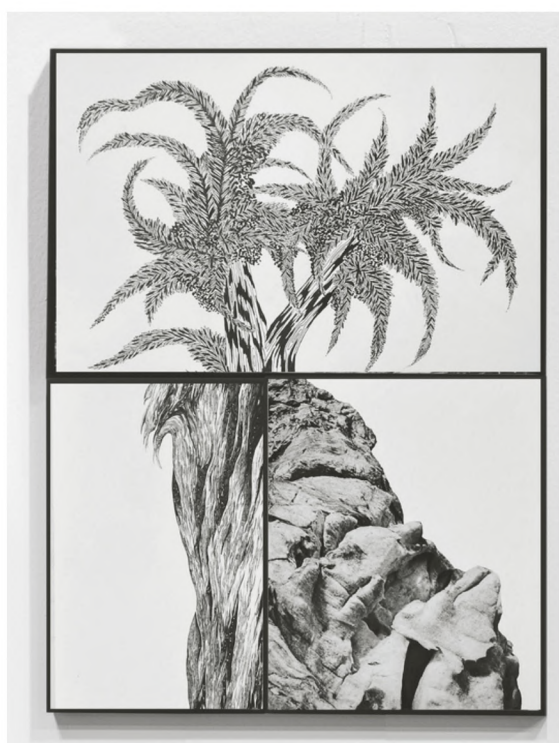
série "paysages fragmentés", 2, dessin sur papier et impression inkjet, 67 x 50 cm. 2500€