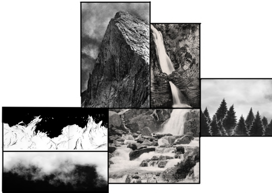
les nuages vacillent et l'eau tombe à verse , 2020, dessin sur papier, impression jet d'encre, 82 x 114 cm. 4000€