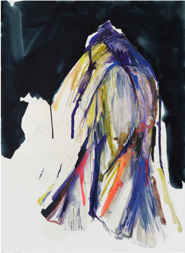
plissé , 2023, aquarelle, mélange d'encre sur papier, 76 x 56 cm. 2400€