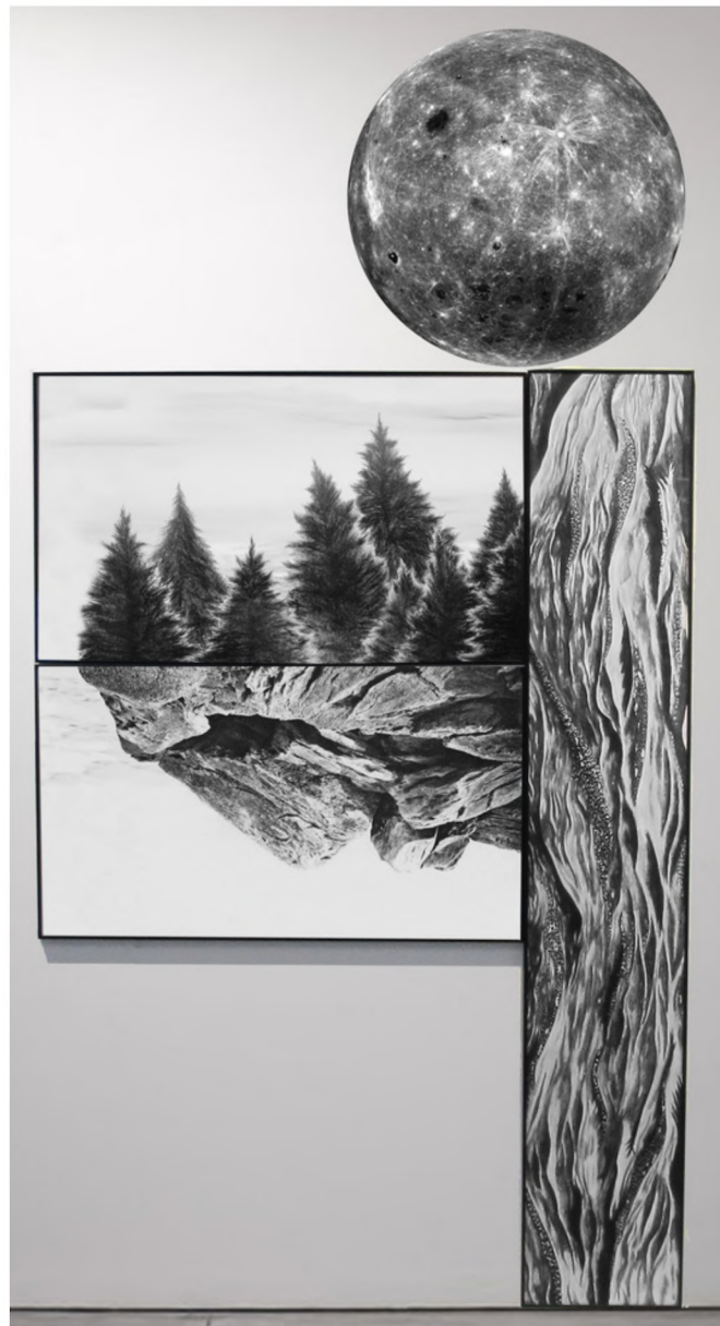
les plis du paysage , 2021, dessin sur papier, impression jet d'encre, 240 x 100 cm. 6000€

« nous trouverons un chemin... ou nous en créerons un. »