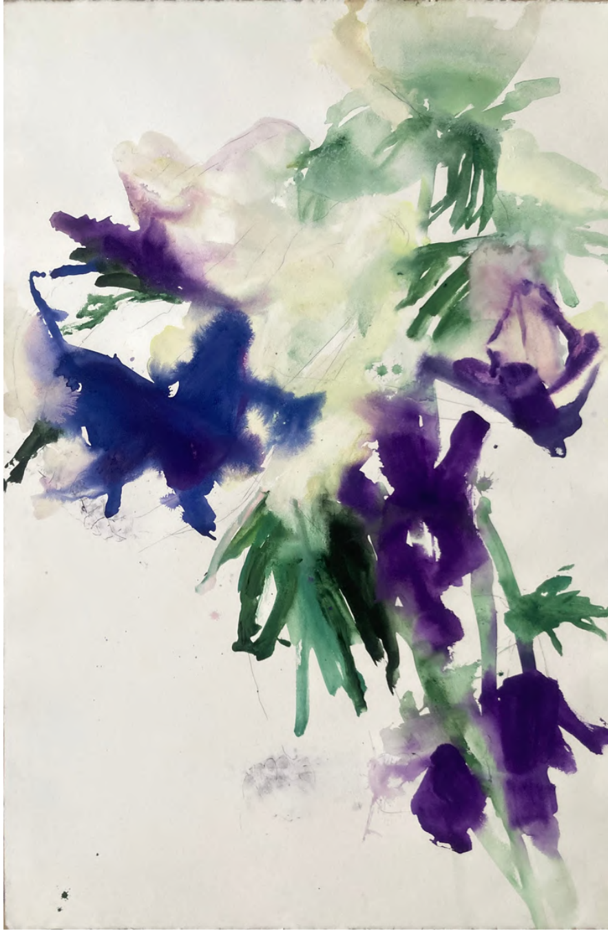
sans titre (anémones, eau, couleurs II), 2024, technique mixte sur papier, 120x80cm. 3800€