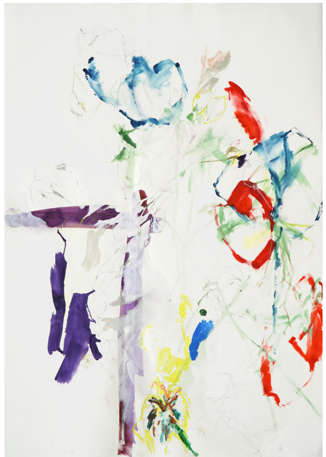
série " fleurs milieu ", 2023, technique mixte sur papier, 100 x 70 cm. 3000€