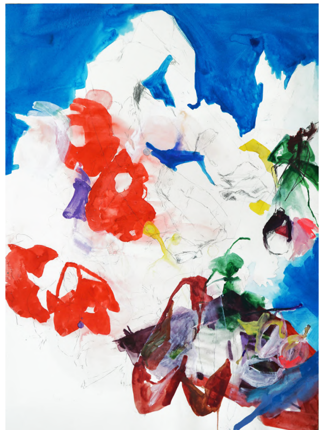
série "fleurs milieu", 2024, technique mixte sur papier, 76 x 56 cm. 2700€ (enc.)